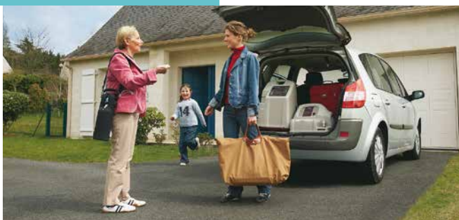
Det er enkelt å reise med det mobile systemet.